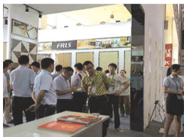
新颖设计迎来客商的关注